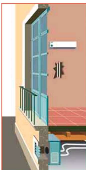
Installation d'un climatiseur dans une menuiserie

1- Dans la totalité de la baie (soupirail)